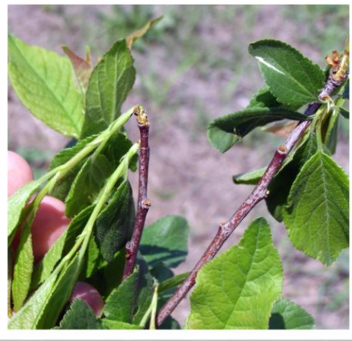
Фотография 4. Повреди от възрастното, източник: проф. д-р Р. Андреев

Имагиниралите бръмбари изгриват отвор и излизат навън. Има два периода, на поява на възрастното: първи - през пролетта (март - април), когато излизат презимувалите и втори, когато се появяват възрастните от новото поколение - в края на юли и август.