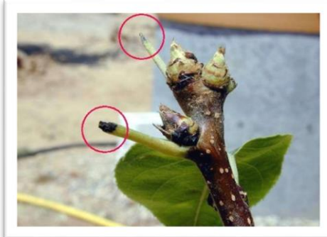
Фотография 5. Повреди от възрастното

младите клонки бръмбарът прави нагривания по кората. Освен това прегрива младите върхни леторасти, които или падат, или увисват на част от неизгриваната кора и така изсъхват. В овощните разсадници често се срещат не