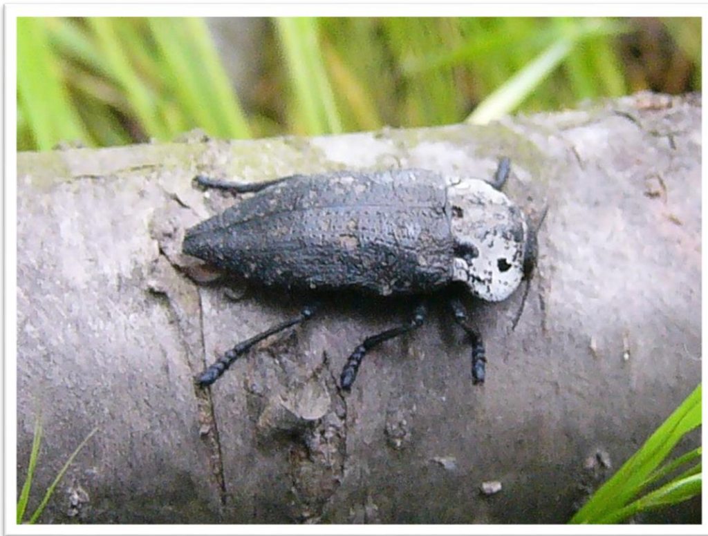
Фотография 1. Възрастен екземпляр на черната златка ( Capnodis tenebrionis )

Насекомните неприятели, които прекарват една част от своето развитие във вегетативните органи на растенията, най-вече в кората и дървесината, причиняват повреди по растенията, които постепенно ги отслабват и често довеждат до загиването им. В овощните градини често се срещат изсъхнали дървета, нападнати от такива вредители. Черната златка ( Capnodis tenebrionis ) (Coleoptera: Vuprestidae) (Бръмбари: сем. Бронзовки)