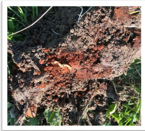
Фотография 7. Повреди от ларви по корена, източник: ОДБХ Варна

Ларвите имат характерна форма. Те нанасят основните повреди по корените на нападнатите растения.