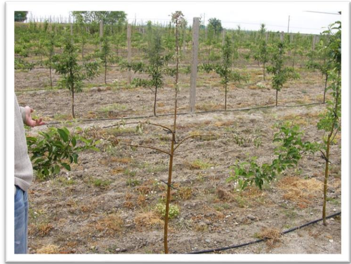
Фотографии 14 и 15. Нападнати млади дървета от черна златка, източник: проф. д-р Р. Андреев