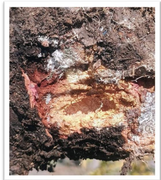
Фотография 8. Повреди от ларва

По нападнатите части се появява потъмнял и слабо хлътнал участък, който показва хода на ларвата към корена на дървото. Този признак се забелязва на повърхността на кората и се наблюдава по-добре при сливовите дървета, които имат по-тънка кора на корена. При кайсията и прасковата входът, през който се вгризва ларвата, е трудно забележим, но на същото място се наблюдава характерно изтичане на смола.