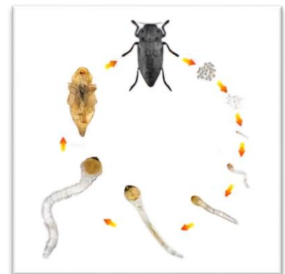
Фотография 2. Жизнен цикъл на черна златка

Възрастното насекомо е сравнително едър бръмбар, с матов черен цвят, който достига на дължина до 3-3,5 см. Яйцето е млечно бяло, твърдо, непрозрачно. Новоизлюпената ларва е белезникава, червеобразна, без крака, с дължина 4-5 мм, а ларвата от последна възраст достига до 6,5 см. Какавидата е бледожълта и достига дължина до 3,5 см.